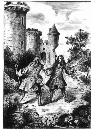
" Vie Illustrée de Duel de J. de la Fontaine et du Capitaine Poignant au Château de Chaury surpris Jean de la Fontaine à se battre en duel avec son meilleur ami, l'ancien Capitaine de Dragons, Poignant Compatriote de Racine. Si trace des font. Chaury à Château Chaury